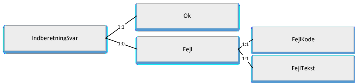
Figur 4.2 XML struktur for IndberetningSvar